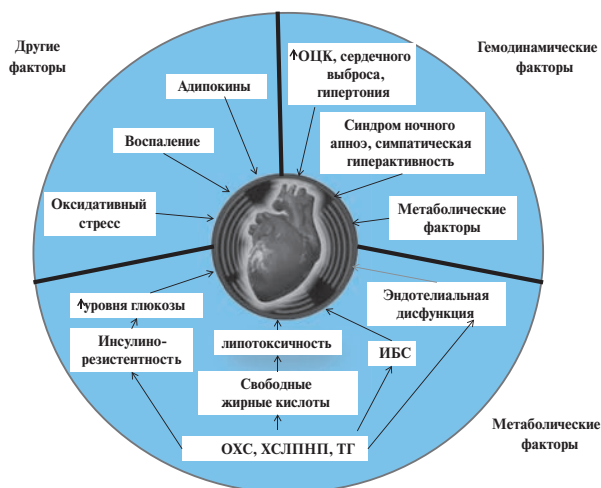
Рис. 1. Механизмы влияния ожирения на миокард [7].

на животных [6]. Кроме того, в ряде исследований доказано увеличение маркеров окислительного стресса в миокарде у мышей с ожирением.